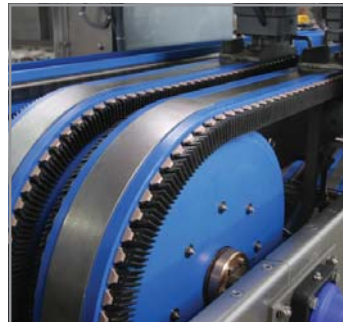
Einfache Klemmweitenverstellung ohne Formateile.